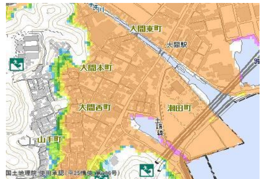
施設周辺の浸水予想図（橙色部分が浸水深5～10m）